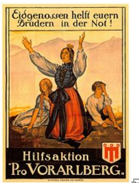
Abb. 2: Werbeplakat des Komiteés „Pro Vorarlberg“ 1919/20