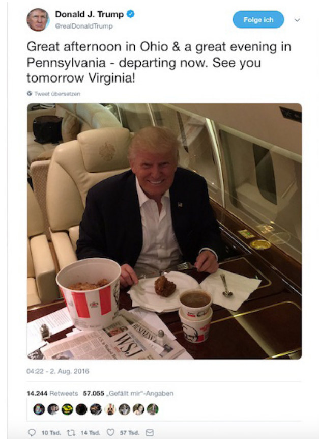
Abbildung 3: Donald J. Trump an Bord seines Flugzeugs während des Präsidentschaftswahlkampfes am 02.08.2016.

Screenshot eines Tweets von Donald J. Trump, veröffentlicht am 02.08.2016 ( https://twitter.com/realdonaldtrump/status/760299757206208512?lang=de )