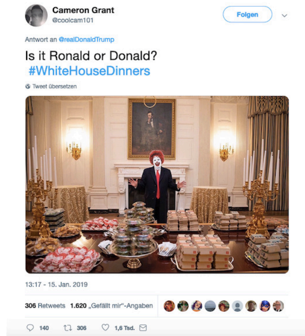
Abbildung 4: Reaktion eines Twitter-Users auf das Foto aus dem State Dining Room

Screenshot eines Tweets des Users Cameron Grant, veröffentlicht am 15.01.2019 ( https://twitter.com/realdonaldtrump/status/760299757206208512?lang=de )