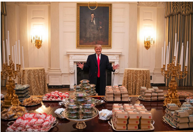
Abbildung 1: Donald J. Trump im State Dining Room des Weißen Hauses während eines Empfangs der Clemson Tigers am 15.01.2019.

veröffentlicht auf dem offiziellen Twitter-Account des Weißen Hauses ( https://twitter.com/WhiteHouse/status/1084988299041738752).